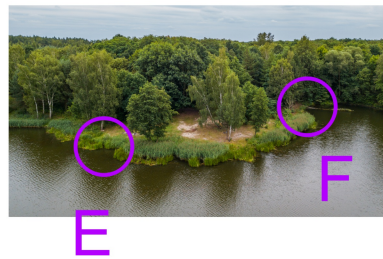
Budowniczy: Agnieszka Ćmiel PlnO 713

Kolejność: dowolna Długość trasy: ok 2,2km Limit czasu: 60+15' Ilość PK: 11+3 Skala: nieznaną, różna zdjęć i schematu